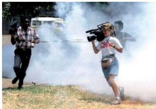
Journalisten sind oft an vorderster Front dabei.